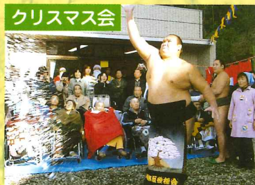
豪快な塩まきを披露した北桜閣。