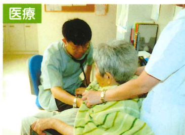
各居室への廻診で、健康チェックも万全。