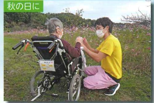
近くのコスモス畑で深呼吸。