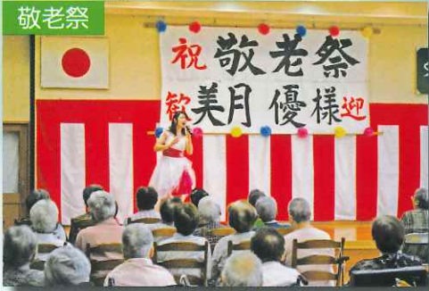
歌謡ショーで長寿のお祝いをいたします。