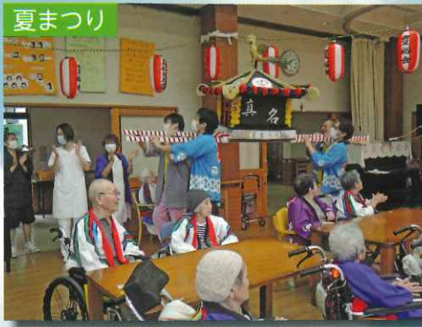
盆踊りや職員によるおみこしや屋台などを楽しんでいただきます。